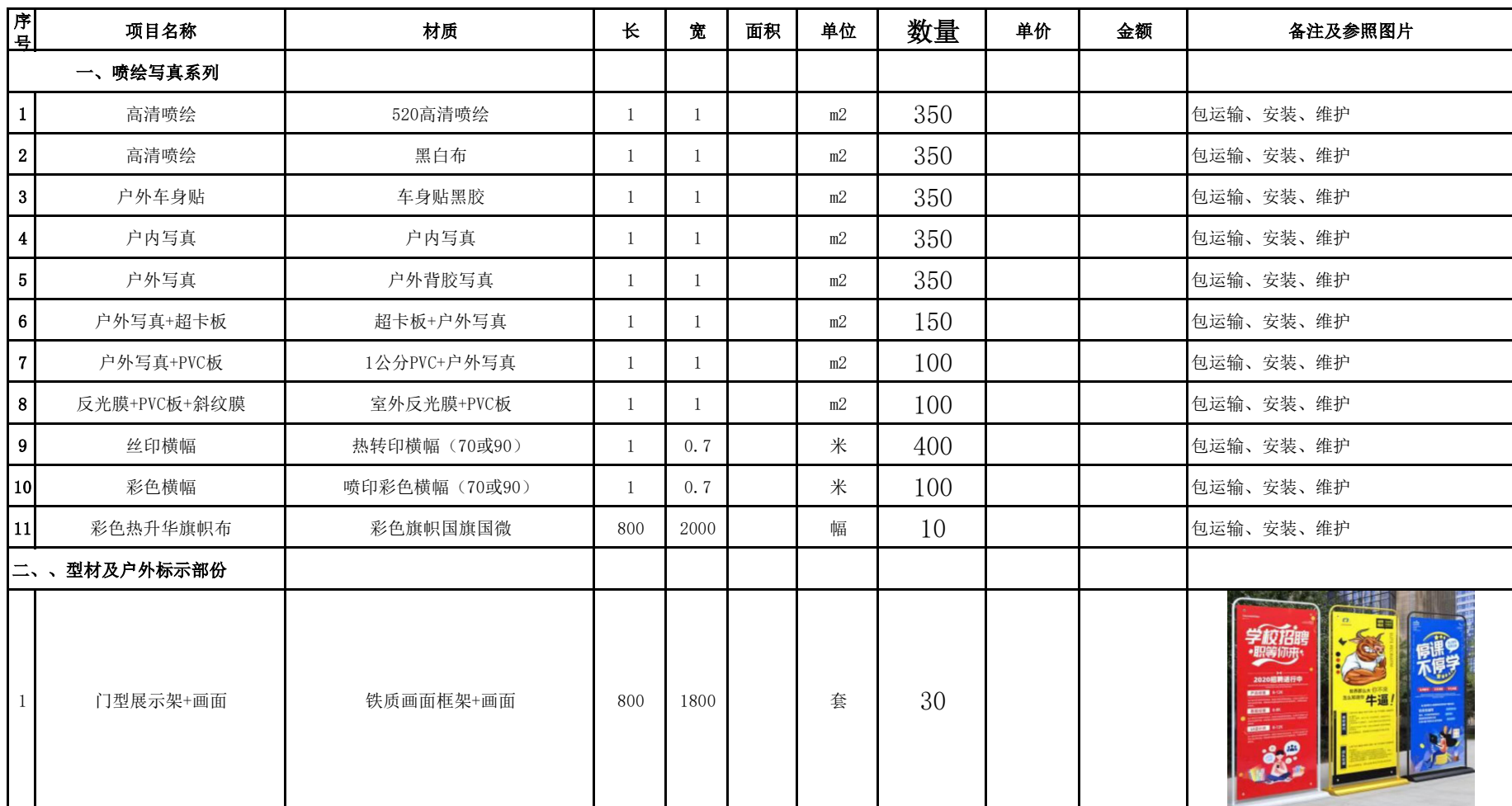
2024年盐校物料预计采购明细列表